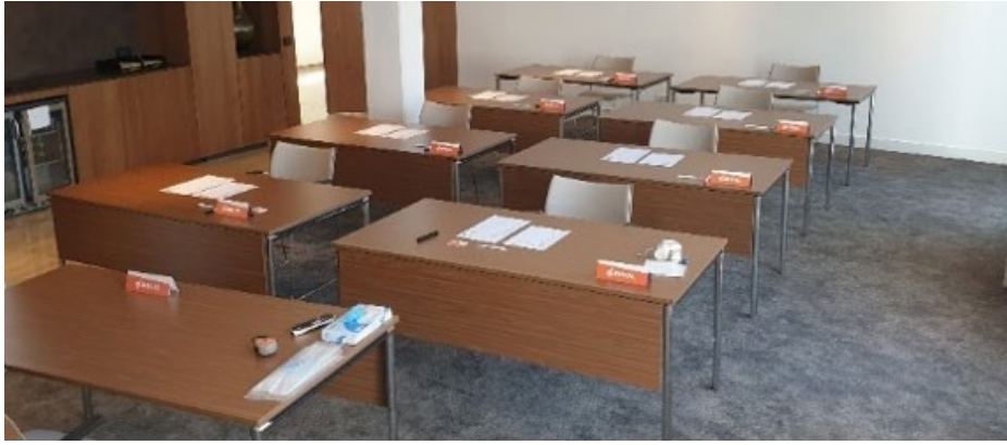
Afbeelding 1.1: Foto opstelling trainingsruimte